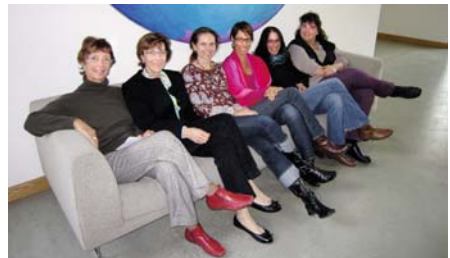
EIN RUNDUM STARKES TEAM

Es gibt häufig Situationen, in denen jemand zu uns sagt: «Niemand hat Verständnis für mich». Angehörige sind in Ausnahmesituationen verzweifelt und wirken verunsichert. Wir beruhigen sie, so gut wir können. An Sonntagen, wenn es ruhig ist,