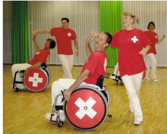
SPORT TUT GUT, OB DRINNEN...

Als naturheilkundliches Mittel für die Behandlung leichter und mittelschwerer Depressionen kann auch ein hochdosierter Johanniskraut-Extrakt eingenommen werden. Die Hauptwirkstoffe des Johanniskrauts, Hyperforin und Hypericin, bewirken vergleichbar mit den pharmazeutischen Antidepressiva eine Wiederaufnahmehemmung unter anderem der Neurotransmitter Serotonin und Noradrenalin. Ein weiterer Effekt des Johanniskrauts ist die Steigerung der Lichtempfindlichkeit, welche schon bald nach der