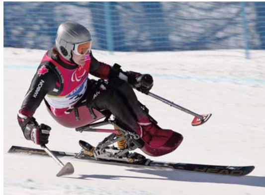
... ODER DRAUSSEN

ersten Einnahme eintritt. Die Wirkung als Antidepressivum jedoch tritt wie bei den pharmazeutischen Antidepressiva erst nach Wochen ein. Somit kann eine Einnahme des Präparates bereits vor Eintreten der Symptome empfehlenswert sein. Im Handel sind unter anderem hochdosierte Präparate erhältlich, die nur einmal täglich eingenommen werden müssen (z. B. Deprivita® Tbl.).