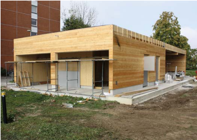
Ein neues Zuhause für die Ponys

Monats von Mitte August bis Mitte September fertiggestellt.