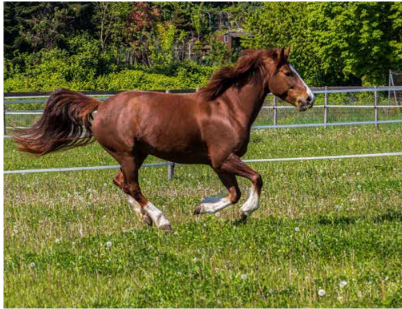
Fenia geniesst die weite Wiese.

Es wurde auch schon damit begonnen, mit Patient*innen zu trainieren. Nina Eigenmann: «Den Patientinnen und Patienten bereitet es grosse Freude, in diesen Trainingstherapien mitzumachen und zur Ausbildung der Pferde beizutragen. Wir Fachleute, die Patienten und die Pferde bilden zusammen das Ausbildungsteam.»