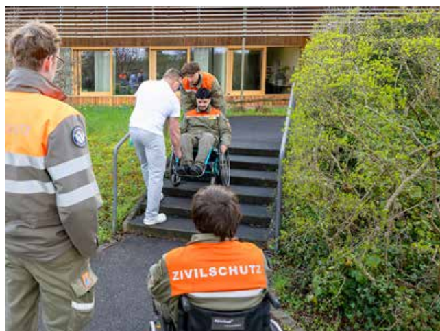
Eine grosse Herausforderung mit dem Rollstuhl sind Treppen.

Der halbe Tag hinterliess Eindruck. Einige Aussagen aus der Schlussrunde: «Mir hat der Besuch im REHAB gezeigt, wie schnell sich das Leben total verändern kann. Ein kurzer Moment, und alles ist anders.» «Ich hätte nicht gedacht, dass Rollstuhlfahren so schwierig ist.» «Mich hat beeindruckt, wie sehr man der Begleitperson vertrauen muss. Man gibt viel Kontrolle ab.» «Obwohl es hier im REHAB so viele harte Schicksale gibt, ist es eine angenehme Atmosphäre. Ich habe erwartet, dass man hier eine Schwere spürt, aber es ist nicht so.»