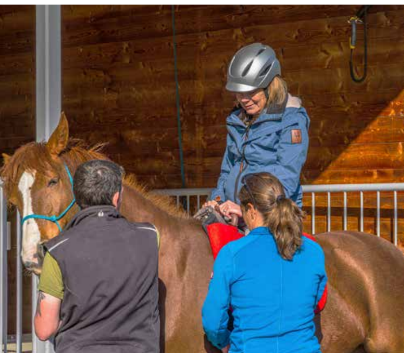
Fenia wird Schritt für Schritt als Therapiepferd ausgebildet.