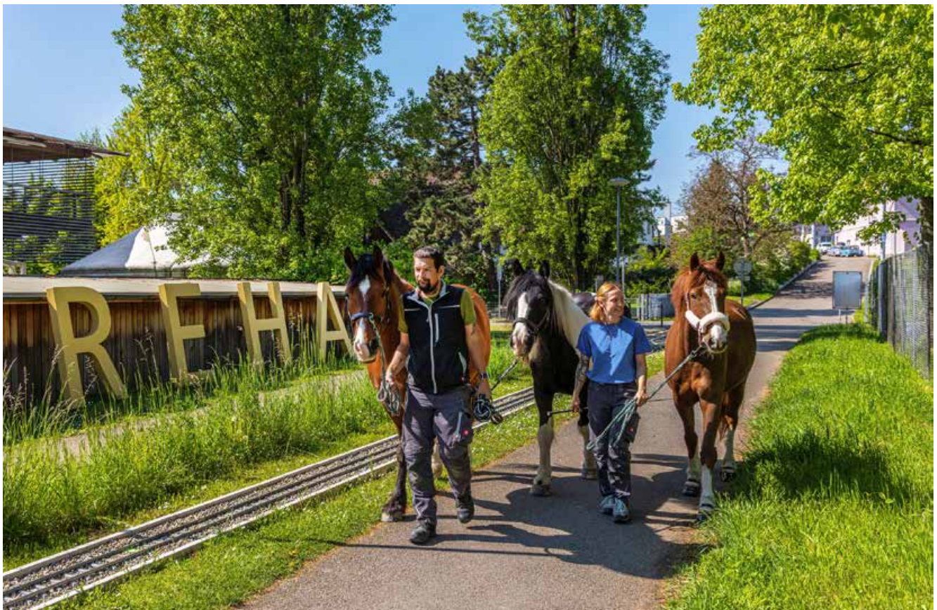
Haribo, Meadow und Fenia (v.l.n.r.) werden spazierengeführt.