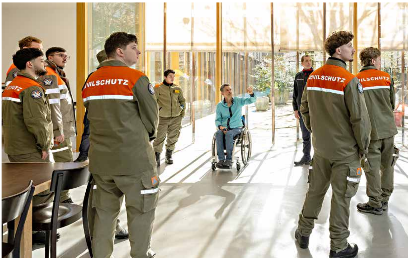
Keine Schwere im REHAB trotz harter Schicksale.

Der Workshop im REHAB mit jungen Männern, die sich im Zivilschutz mit dem Schwerpunkt «Betreuung» ausbilden lassen, hat schon Tradition. Eine ihrer Kernaufgaben ist der Umgang mit schutzbedürftigen Menschen, deren Betreuung und Versorgung. Im März war wieder eine Gruppe in unserer Klinik.